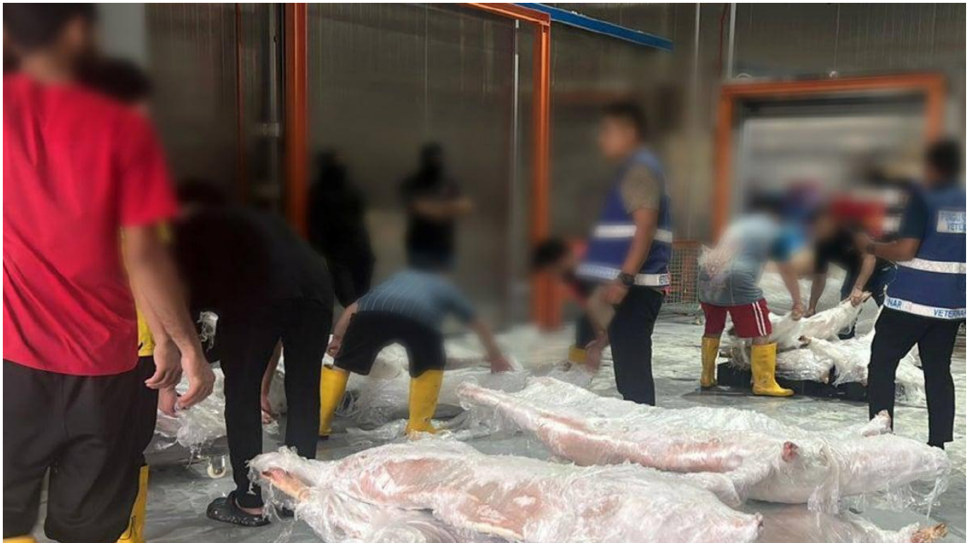
Antara rampasan dalam Ops Taring Chiller membabitkan 22 karkas daging babi sejuk beku di sebuah premis di Skudai, Johor, hari ini.

Skudai: Seramai tujuh individu termasuk enam lelaki warga Nepal dan seorang wanita tempatan ditahan pihak berkuasa selepas disyaki menyimpan karkas daging babi tanpa kelulusan penyembelihan sah di sebuah premis makanan sejuk beku di Kawasan Perindustrian Selaran, di sini, hari ini.